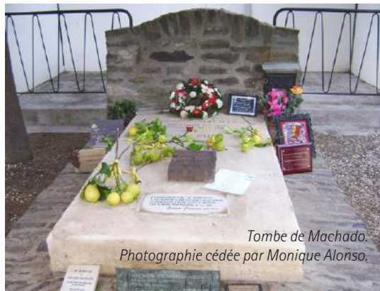
Tombe de Machado.

Et même par une nuit sombre de 2007, deux femmes placèrent, dans un anonymat total, une céramique collée à la dalle, avec les derniers vers du poème Portrait .