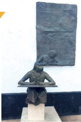
Monument à Machado au Palais de las Dueñas, 2016.

Antonio Machado est né dans une des modestes maisons qui étaient louées dans l'enceinte du Palais car son père était alors gestionnaire de la Casa de Alba. Et c'est ce milieu, la famille (marquée par les personnalités singulières du grand-père, du père et de la mère) et l'environnement (avec ses potagers et citronniers, le patio central, les galeries...), qui forment depuis l'enfance l'homme, le penseur et le