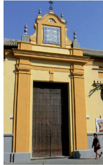
Entrée principale et façade de l'église San Juan de la Palma.

Très près du Palais de las Dueñas (C/ Feria, 2), elle se dresse, comme tant d'autres, au centre historique de la ville, à l'emplacement d'une ancienne mosquée, et renferme les caractéristiques du gothique-mudéjar de Séville. Après de nombreux agrandissements et réformes réalisés au cours des siècles, il ne reste plus de sa structure originale que la voûte mudéjar de la Chapelle Sacramentelle et un portail gothique intéressant. Antonio Machado fut baptisé dans cette église San Juan de la Palma le 28 juillet 1875, face au même autel où des années plus tard se mariait son frère Manuel.