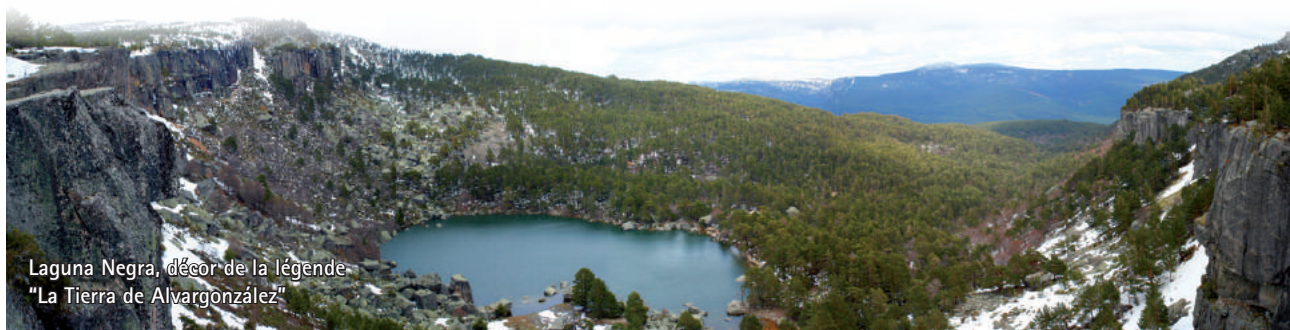
Laguna Negra, décor de la légende "La Tierra de Alvargonzález"