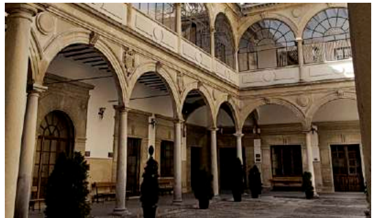
Rue du Professeur Juan Cruz (ancienne rue Cobertizo)

Dans cet établissement, Antonio Machado occupa une des salles du Patio Renaissance, appartenant à l'ancienne Université qui se trouve à côté de l'Amphithéâtre.